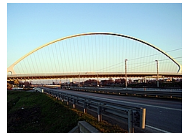
3 PONTI CALATRAVA