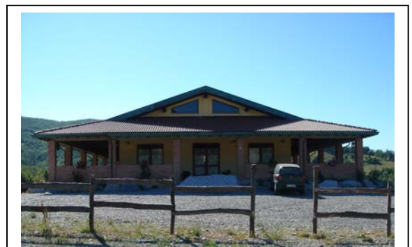
Pranzo Agriturismo "Repetto"