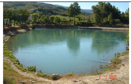
Gara di pesca al lago

Si prega di prenotare entro e non oltre 1 aprile 2006 alle ore 22.00 presso: CLUB SPORTIVO SILENZIOSO DI GENOVA fax 0107402826 oppure 0108397449.